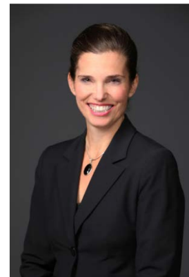
L'honorable Kirsty Duncan

Ministre de l'Innovation, des Sciences et du Développement économique