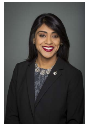
L'honorable Bardish Chagger

Ministre de la Petite Entreprise et du Tourisme