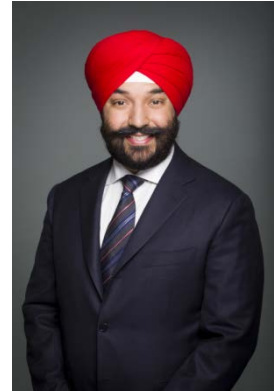
L'honorable Navdeep Bains

Le premier ministre et le président du Conseil du Trésor cherchent à simplifier et à rendre plus efficaces les processus redditionnels de manière à ce que le Parlement et les Canadiens puissent suivre les progrès du gouvernement dans ses efforts pour offrir de réels changements à la population. À l'avenir, les rapports du Conseil de recherches en sciences humaines au Parlement seront davantage axés sur la transparence en ce qui