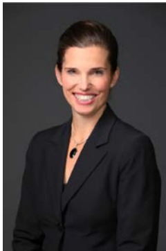
L'honorable Kirsty Duncan Ministre des Sciences

J'ai le plaisir de vous présenter le Plan ministériel du Conseil de recherches en sciences humaines pour 2017-2018.